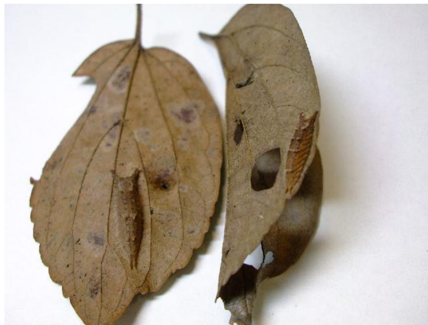
ゴマダラチョウの幼虫(左)とムーちゃん(右)

オオムラサキ自然公園のエノキの根本では、オオムラサキの幼虫(ムーちゃん)とゴマダラチョウの幼虫が越冬しています。どちらも食樹はエノキです。