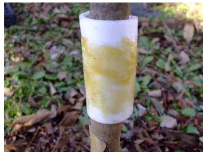
タングルフト設置状況

アリニックスやタングルフトを設置した木よりも忌避材を設置していない木のほうが幼虫の生存率が高いという結果がでました。これはアリニックス、タングルフトともに4～6齢幼虫の天敵に対して忌避効果がなかったと考えられます。逆に考えると4～6齢幼虫の天敵はアリなどの歩行性昆虫ではなく、翅を持ちエノキに飛来してくるアシナガバチやカメムシなどの昆虫であることが示唆されます。これは5～6齢幼虫の死亡原因は、アシナガバチ類、鳥による捕食によるとした小林隆人さんらの先行研究（小林・稲泉 1999）を裏付けるものでもあります。