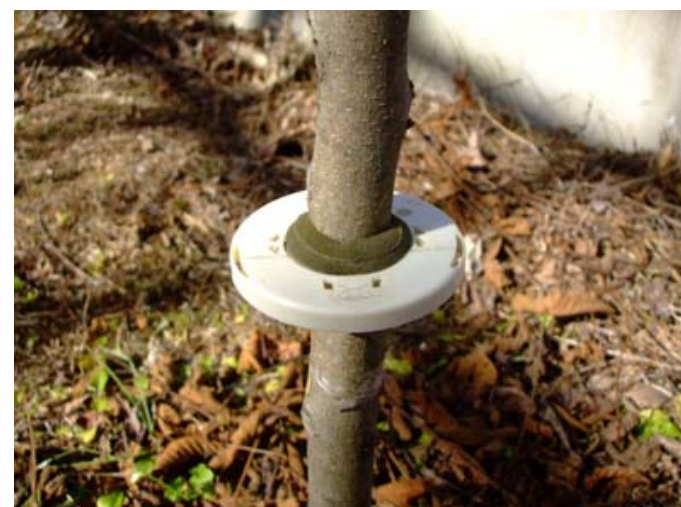
アリニックス設置状況

はじめに起眠後の4～6齢幼虫における実験をしました。15本のエノキを選び、4月後半に越冬から起眠した4齢幼虫をエノキに20匹ずつ配置した後、5本の木の根本にはアリニックスを設置、5本の木にはタングルフトを塗布し、残りの5本は何も忌避材を設置しない木と3つに分け、それぞれの木の幼虫の生存数をカウントし、1週間ごとに生存数がどのように変化していくかを調べました。それぞれの条件下における平均生存個体数と平均生存率は表1のとおりです。